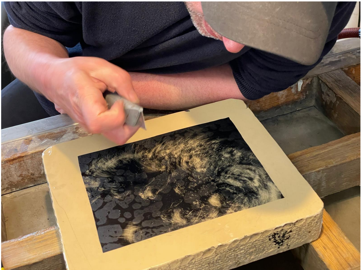
Een kunstenaar van Sunflower Soup tekent de lithosteent

Het kunstenaarscollectief Sunflower Soup, verbonden aan Plaatsmaken in Arnhem, heeft in 2025 een lithografieproject uitgevoerd in het museumatelier onder leiding van de drukkers van het museum. Naar aanleiding van de expositie Als de kat van huis is hebben zij tijdens een artistieke verbeelding van de kat gegeven. Tevens is in samenwerking met Plaatsmaken een presentatie gegeven. Sunflower Soup is een collectief dat in 2021 is opgericht met als doel kunst en activisme met elkaar te verbinden. De leden van Sunflower Soup zijn opgeleid als kunstenaars. Zij zijn daarnaast de laatste jaren ook actief in klimaat-, woon- en anti-racismeprotesten. Sunflower Soup maakt onder andere tentoonstellingen, tekeningen, zines en soep.